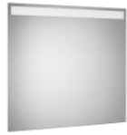
Espejo con luz superior