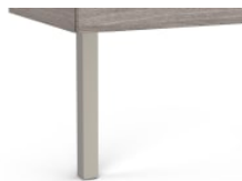
Conjunto de dos patas opcionales